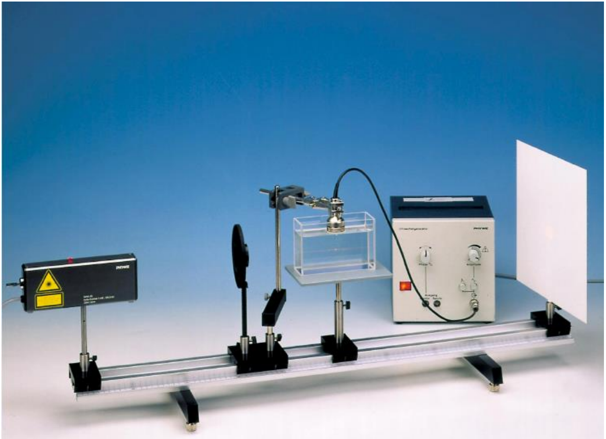
Rys. 1. Zestaw do pomiaru prędkości ultradźwięków metodą optyczną.

oświetlimy ciecz rozbieżną wiązką laserową, w której wytworzono falę stojącą, w strzałkach jest ona silnie załamywana dwukrotnie w czasie jednego okresu drgań, a przez węzły przechodzi cały czas bez zmiany kierunku. Można zatem traktować strzałki jak ciemne przegrody, a węzły jak szczeliny. Powyższy fakt stanowi podstawę metody doświadczalnej, dzięki której możemy wyznaczyć długość fali ultradźwiękowej i na podstawie równania obliczyć jej prędkość.